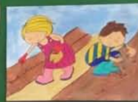
chi fora il terreno