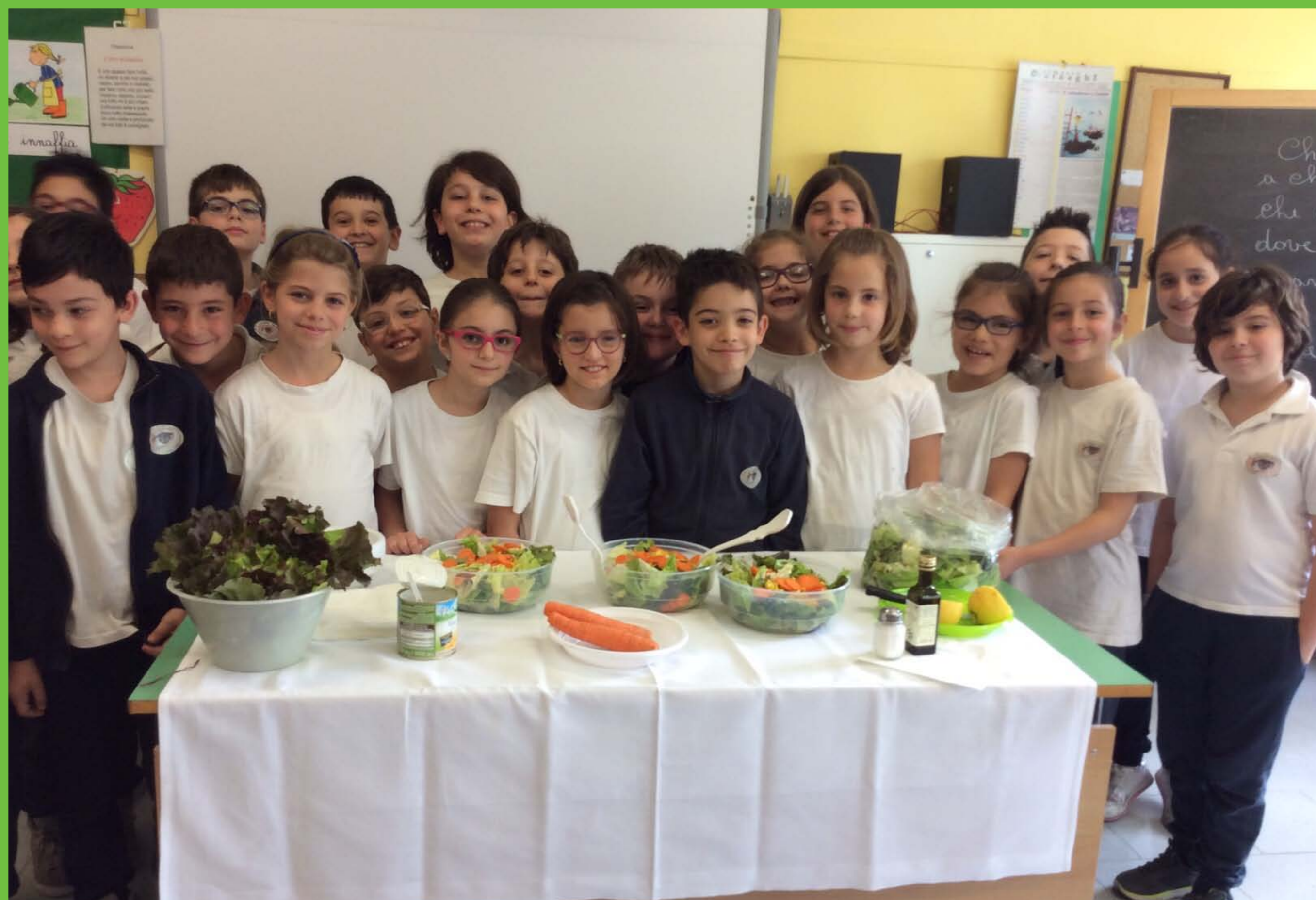
Insalata canasta per merenda.