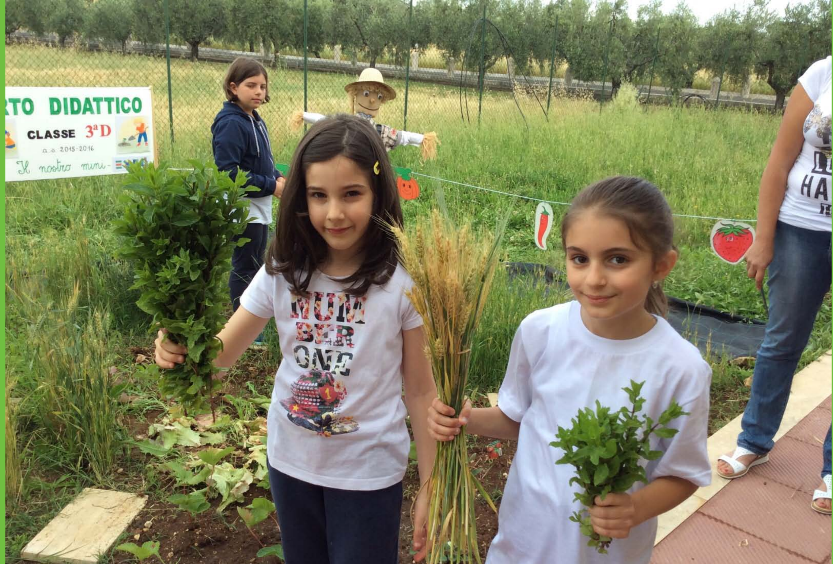
Il primo fascio di spighe e due mazzetti di menta profumata.