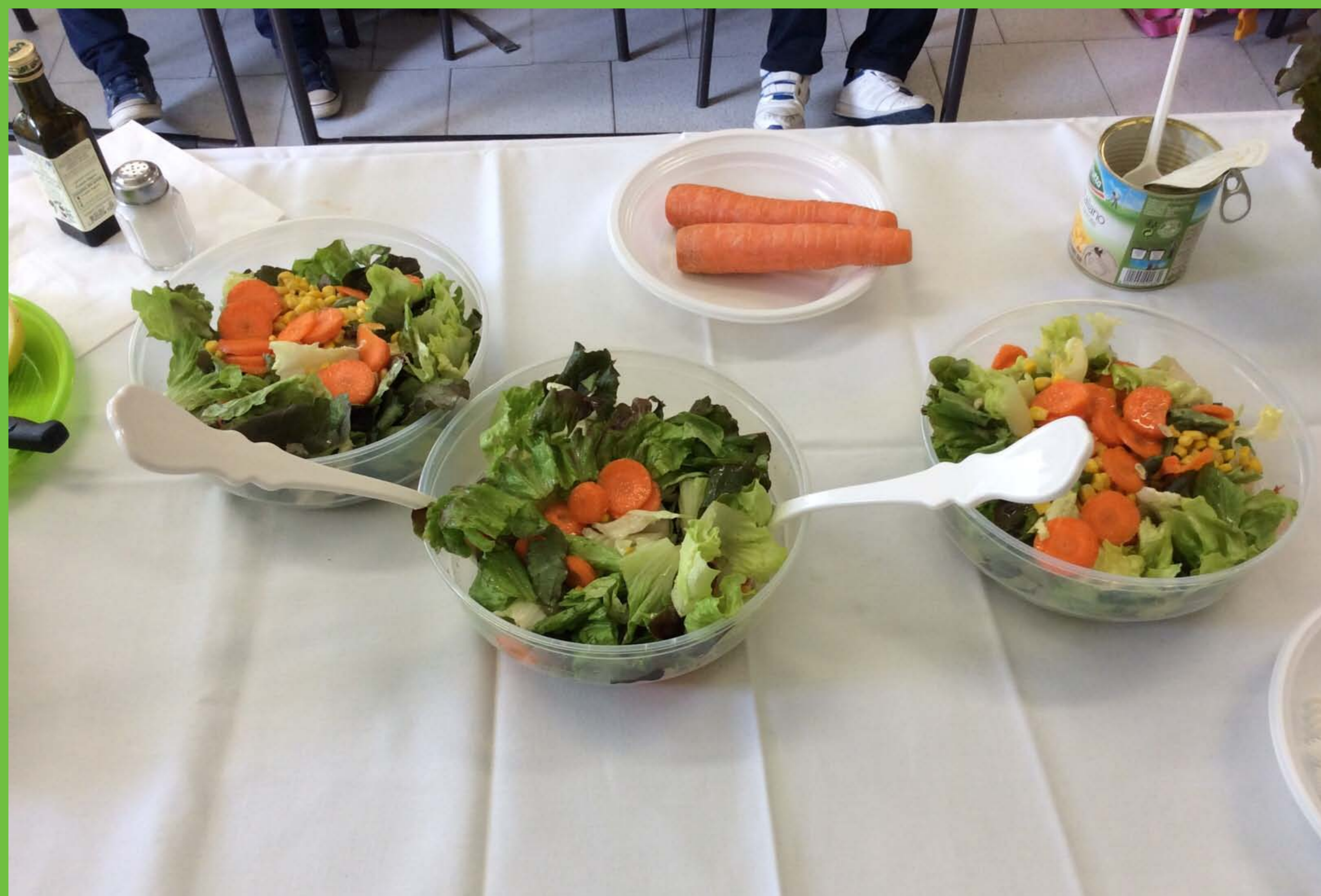
Insalata canasta, carote e mais per merenda.